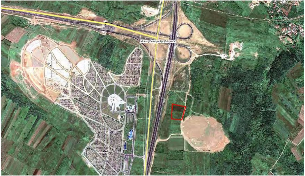
Aviosnimak lokacije katastarskih parcela broj 2071 i 2072 ukupne površine 7.794m 2