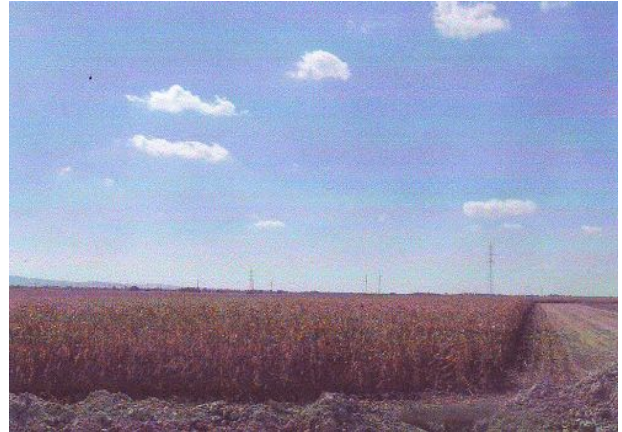
Fotografija parcele pod zasadam

Više informacija na http://www.generalauto.rs/oglasi.php