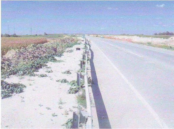
Fotografija Auto-puta E-75, neposredno ispred parcele.