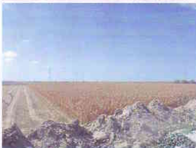
Fotografije predmetne parcele , pod zasadam kukuruza .