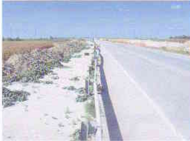
Fotografija Auto-puta E-75 neposredno ispred predmetne parcele .

Za predmetnu kat.parcelu br. 4119/1 , upisanu u list nepokretnosti br. 1334 , k.o. Cenej